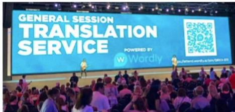
MPI WEC | Main Stage - Mexico

Durante o Congresso Mundial, traduções em vários idiomas estarão disponíveis usando o telefone celular com base em inteligência artificial (IA) ao vivo. Recomenda-se que os delegados tragam seus próprios fones de ouvido se quiserem ouvir a tradução de áudio, ou podem ler as traduções ao vivo na tela do telefone. O idioma escolhido pode ser refletido na tela grande do salão que exibe as legendas. Seguem abaixo alguns exemplos.