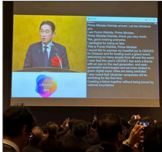
Prime Minister Fumio Kishida CEATEC 2023 | Japan